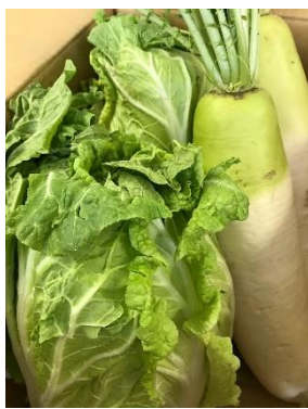
(株)アースクリエイティブさん