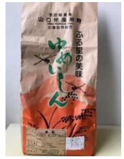
山口県農業法人事業協同組合