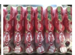
山口アポロ石油 株式会社さん