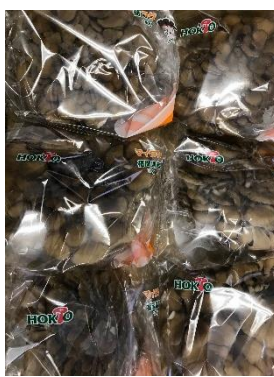
ミウラ化学(株)さん